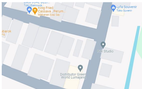
Gambar 2. 1 letak FEK Studio Picture Lumajang ( googlemaps )

Fek Studio berdiri sejak 2013 dengan nama “Fek”, Fek diambil dari akronim Forum Ekonomi Kontrakan, berawal dari sebuah perdagangan barang dari sebuah perdagangan barang dan jasa bersama teman kuliah satu kontrakan yang akhirnya berubah menjadi sebuah rumah usahan yang bergerak dalam bidang audio visual pada tahun 2018 dan berganti nama menjadi “FEK Studio”. Berfokus pada dokumentasi acara, Iklan Layanan Masyarakat, Film Pendek, dan bergerak dalam bidang audio yakni seorang atau pembuatan musik. Berawal dari keingan melestarikan dan mengembangkan dunia film khususnya di Kota Lumajang, hal ini yang mendorong Fek studio hadir menjadi wadah bagi pengiat film untuk berkarya. FEK Studio berdiri di Perumahan Dawuhan Indah AA16 RT53 RW15, Plosorejo, Dawuhan Lor, Kec. Sukodono, Kabupaten Lumajang, Jawa Timur 67352.